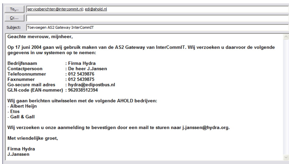
Voorbeeld e-mail voor aanmelden AS2 Gateway

Na verwerking van uw aanmelding wordt door de servicedesk van InterCommIT een bevestiging verzonden naar de afzender van het bericht.